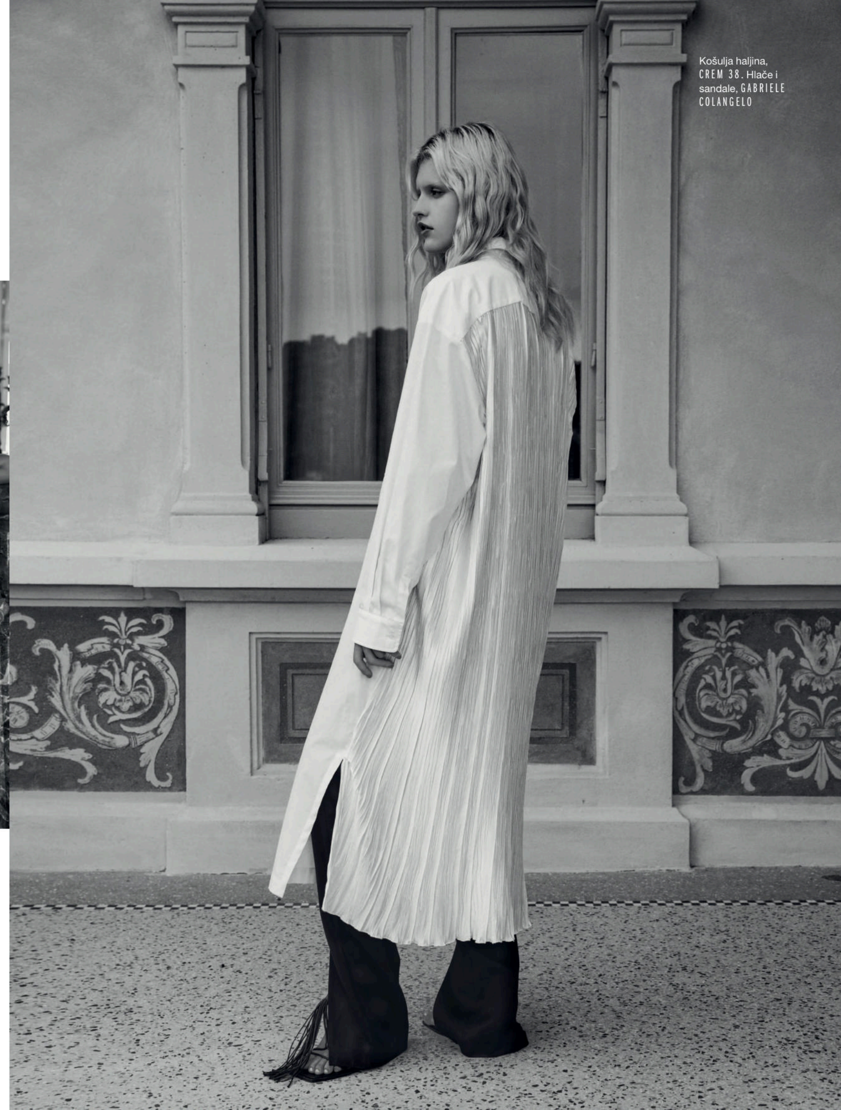
Košulja haljina, CREM 38. Hlače i sandale, GABRIELE COLANGELO