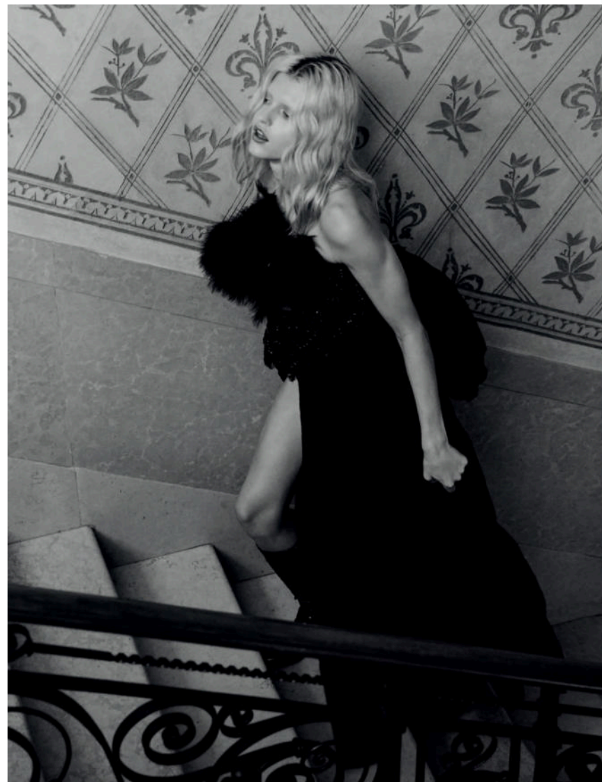
Haljina i cipele, ANTONIO MARRAS